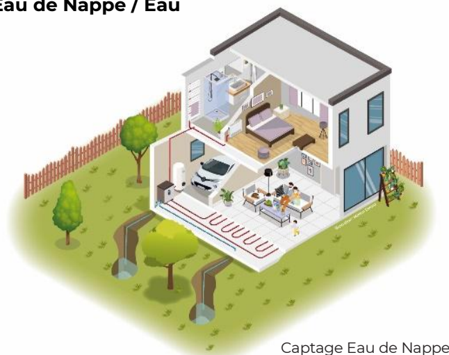
Captage Eau de Nappe